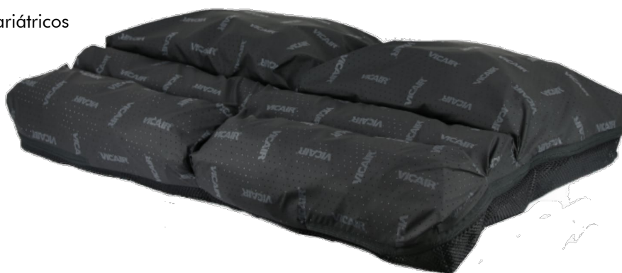
TABLA de PRECIOS / MEDIDAS