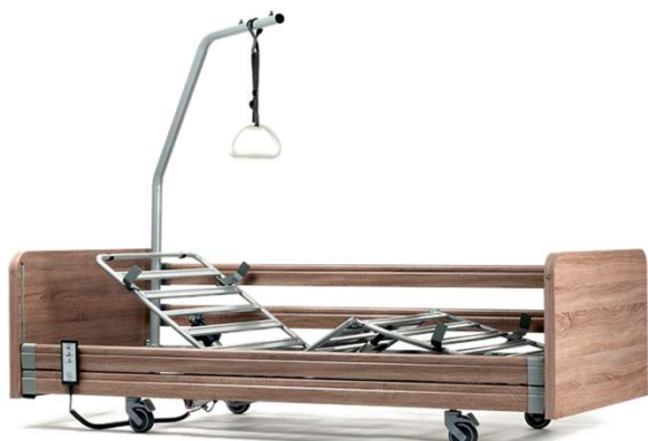
COMPLETA MADERA OXIDE (incorporador opcional)