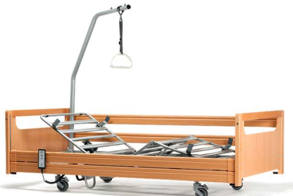
COMPLETA MADERA HAYA (incorporador opcional)