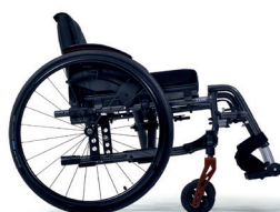
C86 Gris carbón

Tienes la oportunidad de elegir entre una variedad de tonos, lo que te permitirá personalizar tu silla de ruedas y encarnar verdaderamente tu singularidad.