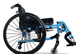
C79 Azul claro