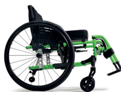
C85 Verde brillante