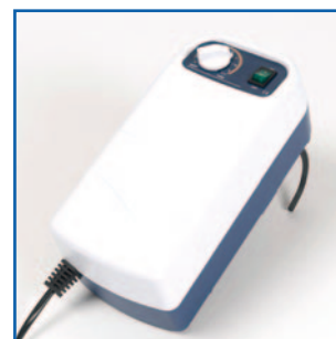
Compresor eléctrico de ciclo alternante con regulación de la presión