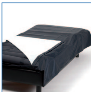
Funda en PVC impermeable y transpirable. De serie sólo para el modelo MAT X3