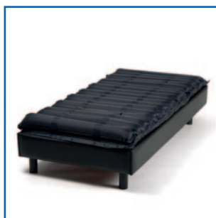
Colchón sobre la cama (sólo fines ilustrativos)