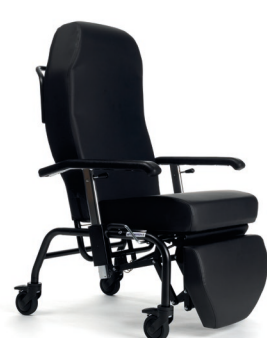
ZW - Cuir artificiel noir