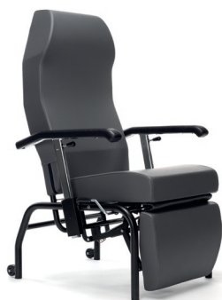
GS - Cuir artificiel gris