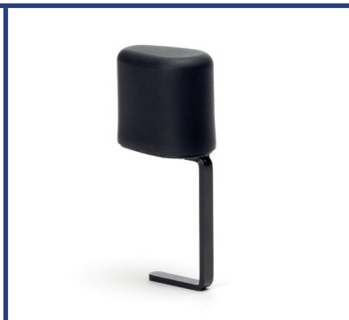
B22 - Plot d'abduction (taille M ou L)