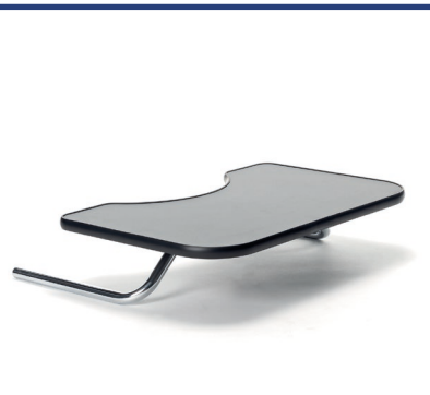
B12 - Tablette