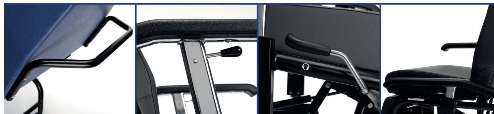
Barre de poussée