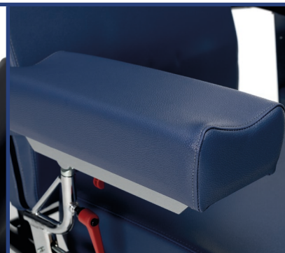
M - Manchette de prélèvement