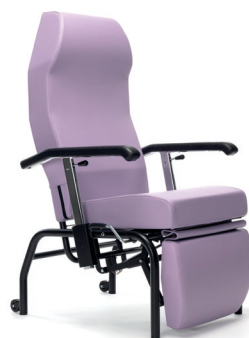
33 - Cuir artificiel lavande