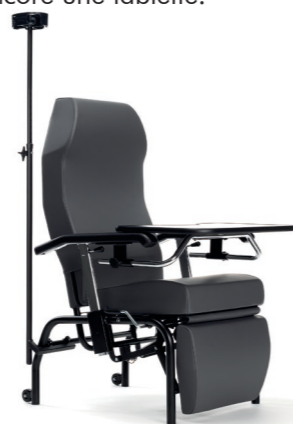
Normandie avec porte-serum et tablette