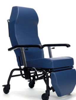
37 - Cuir artificiel bleu