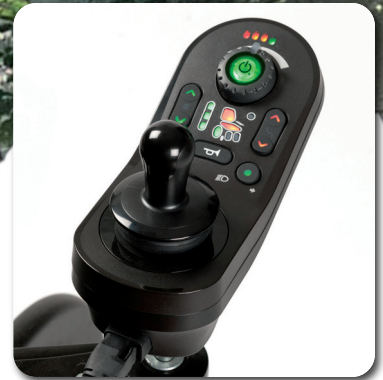
Serienmäßig LiNX ® Steuerung.