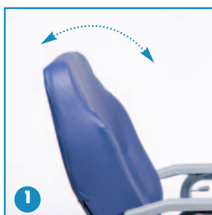
Respaldo reclinable 45°