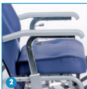
Reposabrazos regulables en altura