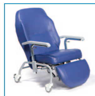
Versión con ruedas