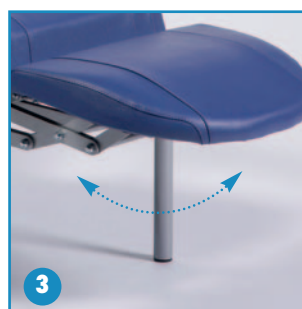
El reposapiernas sube al mismo tiempo que el respaldo reclina