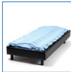
Colchón sobre la cama (sólo fines ilustrativos)