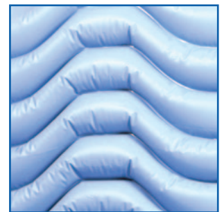
Mat X2 detalle