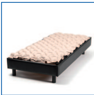
Colchón sobre la cama (sólo fines ilustrativos)