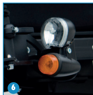
SE19 Luces LED opcional