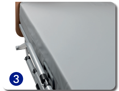
Châssis du lit Illico avec le kit BB10 assemblé