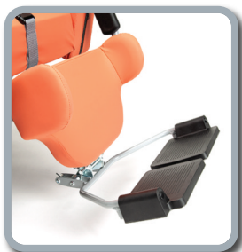
Pedana con appoggia- piedi separati B06 (optional)