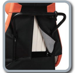
Il rivestimento è completamente rimovibile