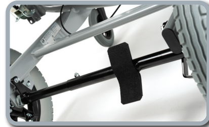
Freno a pedale