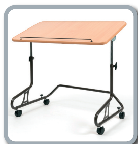
378 - Tavolo opzionale