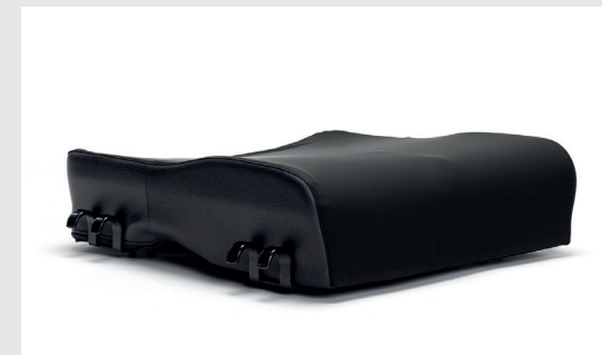
Coussin d'assise anatomique préformé - L35