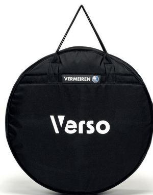
Sac de transport en option

Le Verso vous offre la possibilité de se transformer en un clin d'œil en fauteuil roulant manuel grâce à son kit de roues arrières 24".