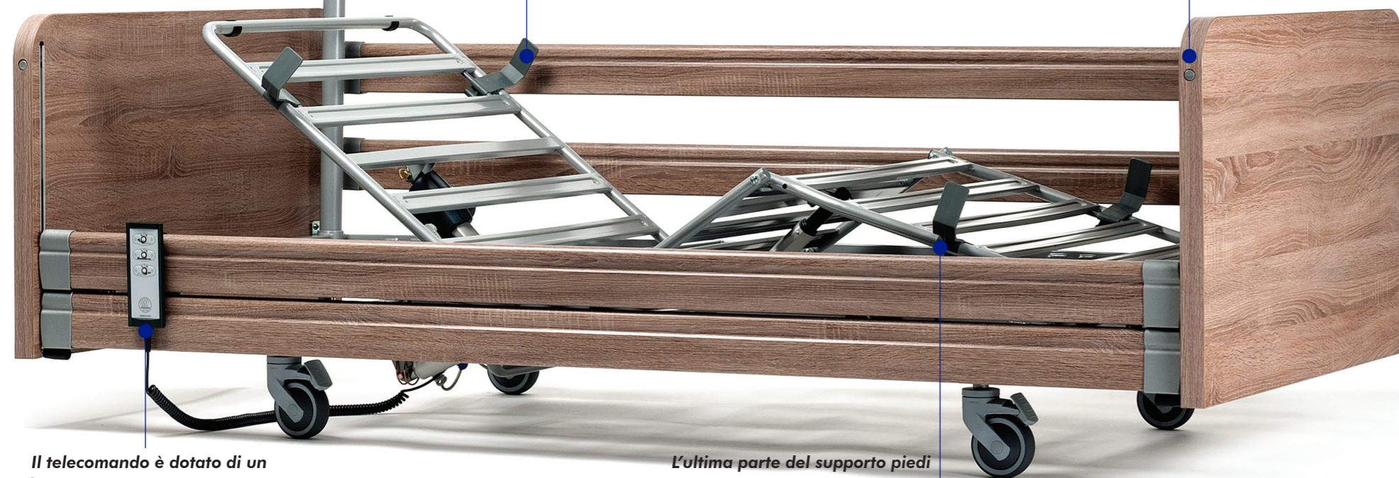
Il telecomando è dotato di un filo a spirale lungo per poterlo posizionare ovunque sul letto.