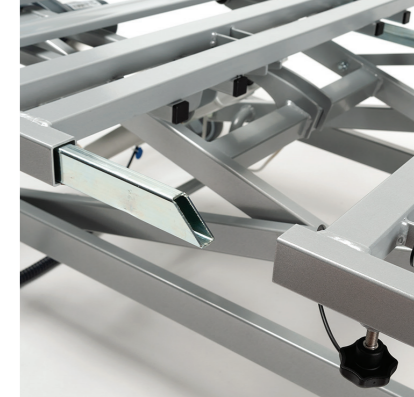
Facile smontaggio del telaio senza utensili