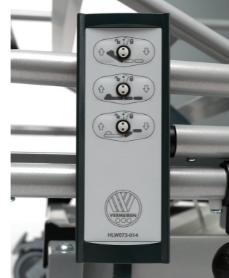
Semplice telecomando con funzioni di blocco