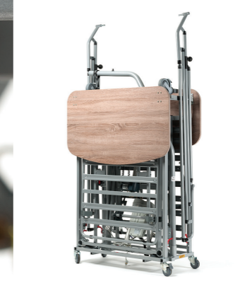
Un kit di trasporto su ruote per un facile spostamento del letto