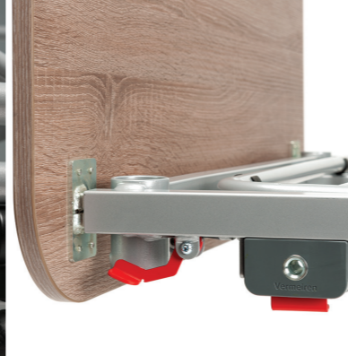
Facile rimozione dei pannelli e delle sponde laterali