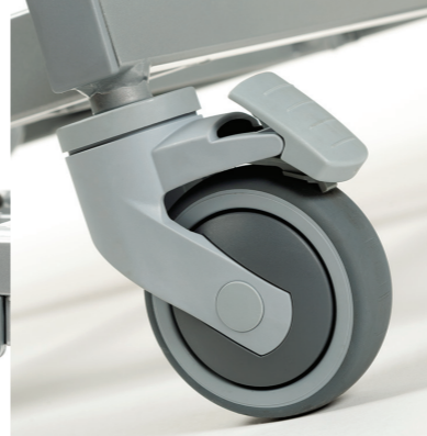
Solide ruote con freno