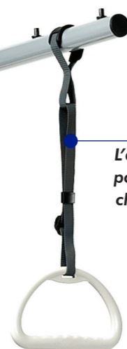
L'asta sollevammati può essere posizionata sia nel lato sinistro che destro del letto. La cinghia può essere regolata alla lunghezza più adatta.