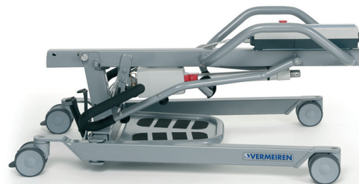
Pieghevole per un facile trasporto

Albatros è indicato per persone con difficoltà a deambulare o non deambulanti.